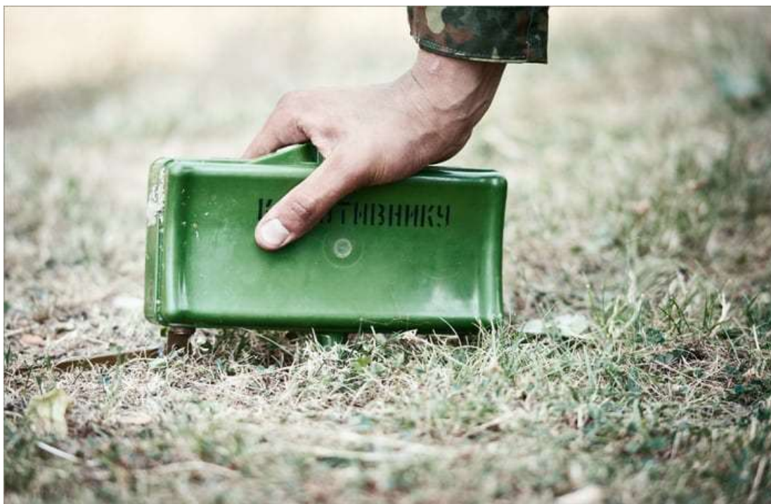
Мина в боевом положении