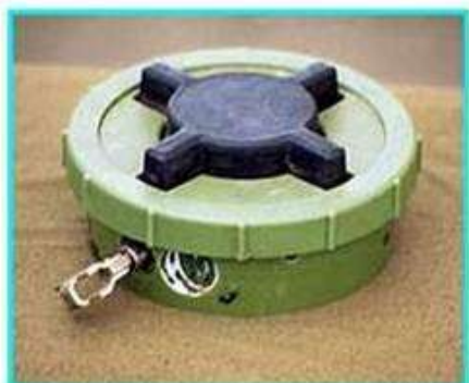
Рис.1 Общий вид мины ПМН-2

ПМН-2 Противопехотная мина нажимного типа