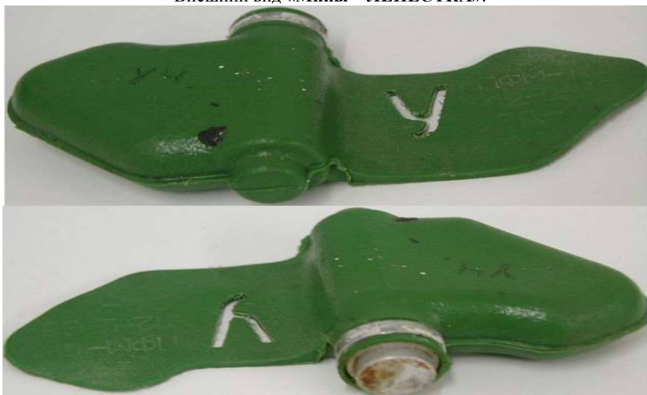
Внешний вид « Мины – ЛЕПЕСТКА »:

Масса мины 80 грамм, размеры – 12 x 6 сантиметров, чувствительность мины лежит в пределах 5-25 кг, что вполне достаточно для срабатывания от веса маленького ребенка.